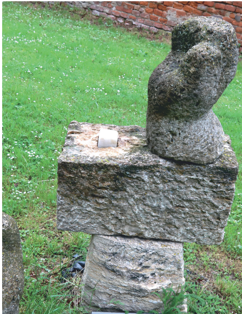
BOHUMIL TEPLÝ: Ruce - torza, travertin. Instalováno v zámeckém parku v Tovačově v okrese Přerov.