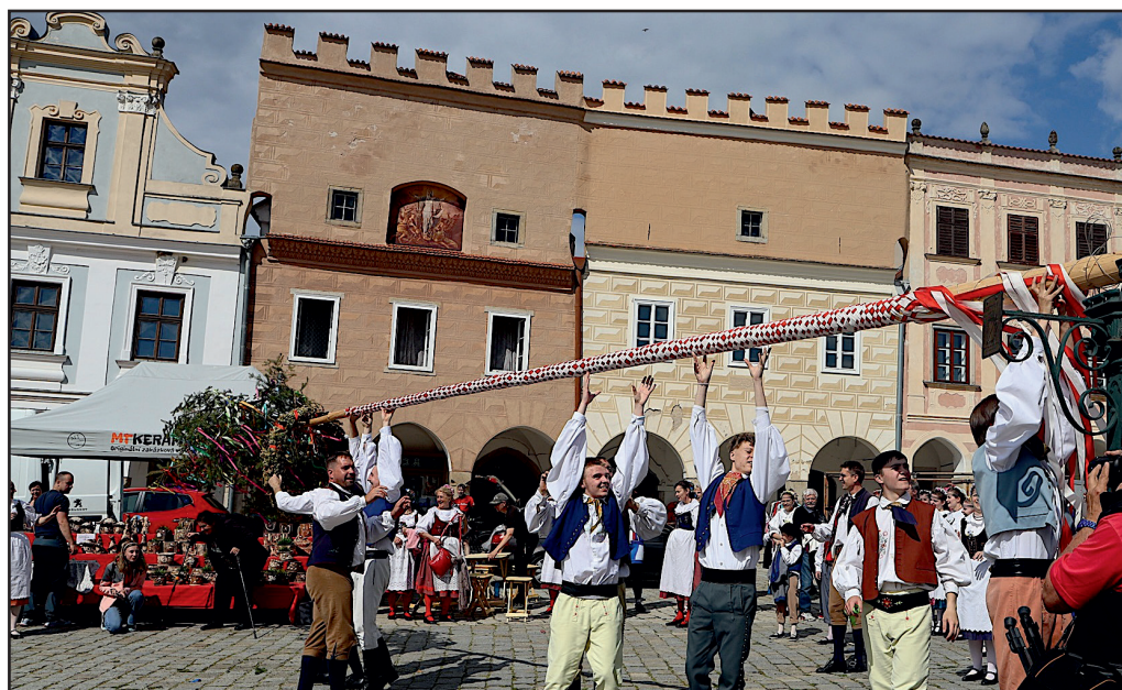
KÁCENÍ MÁJE na náměstí Zachariáše z Hradce v Telči. Historické jádro města v okrese Jihlava bylo v roce 1992 zapsáno na Seznam světového kulturního a přírodního dědictví UNESCO.

Víme a počítáme s tím, že surrealisté druhé až desáté vlny (ošklivě se říkávalo druhého až... nálevu), lpící na podobě surrealismu, nezadávajícího si s tvůrčí aktivitou autora, sotva mohou přijmout Nezvalův a náš výklad osudu surrealismu po roce 1938. Mohou doložit mnoha knihami, sborníky a studii, že surrealismus v původní verzi nadále žije. Nemohou však dokázat, že znamená pro soudobou poezii tak zásadní osvěžující, tak osvobozující význam jako ve druhé polovině třicátých let. Dojde k prudké polemice?