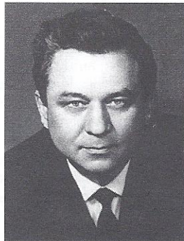
Konon Trofimovič Molodyj

Častou formou spravodajskej hry je podsunutie vlastného agenta, ktorý sa iniciatívne ponúkne nepriateľovi. Cieľom je zistiť, ako cudzie služby zareagujú, či ponuku prijmú, aké sú ich priority a prostriedky spojenia, kde majú konšpiračné byty, aké používajú šifry a kódy.